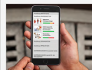
Die WissensBox in der Wasserwacht